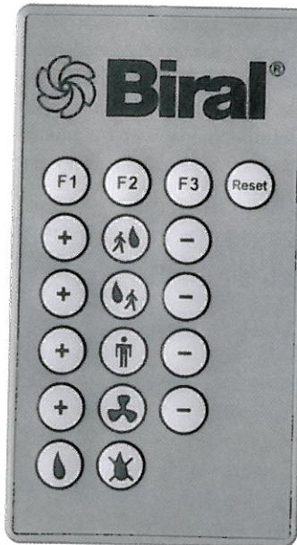
Einfache selbsterklärende Steuerungseinheit

gemacht werden (maximale Einsatzvielfalt).