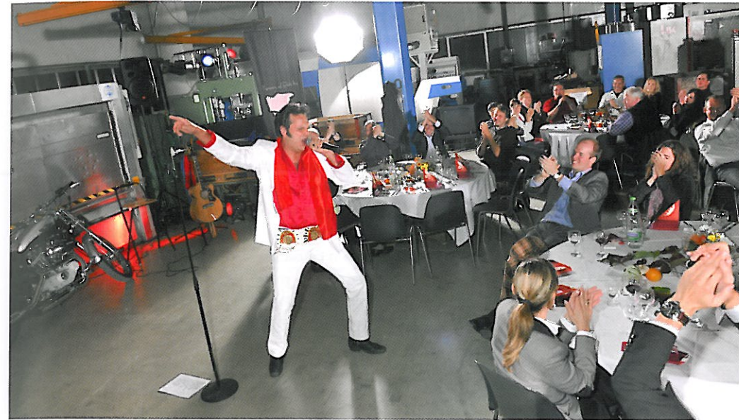
Elvis hervorragend nachgemacht!

Eine Optimierungsfunktion ist eine «Sparfunktion». Erkennt wird, wenn