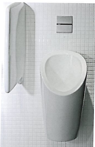
Einfach sauber, hygienisch – weil mit etwas Wasser!

Biral hat eine lange Vergangenheit in der Herstellung von Urinalsteuerungen: Angefangen mit dem Direktspülautomaten (von Keramik unabhängige Steuerungen), dann die integrierten Urinal-Steuerungen in den Urinalen «Taro» und «Tamaro» von Keramik Laufen. Gefolgt von einer kurzen Marktstagnation und heute der Wiedereinstieg mit einer Keramik unabhängigen Steuerung.