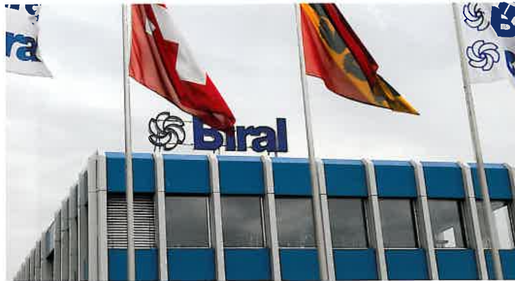
Sitz der Biral AG in Münsingen: Gut die Hälfte des Umsatzes wird in der Schweiz erzielt.