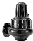
1996 FEC/FWC/FMC Pompes à eaux chargées et matières fécales