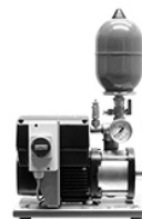
2017 ComBo easy – Installations de surpression compactes