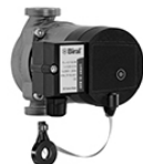
2010 Technologie PM intelligente AXW Smart